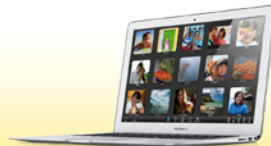
Mac book Air 1台